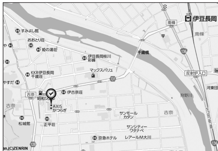
伊豆長岡駅からアクシスカつらぎまで