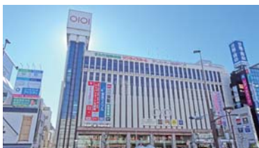
会場の建物(丸井)は 錦糸町駅南口の正面です。